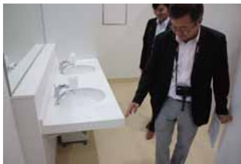
洗面台の安全性の検証