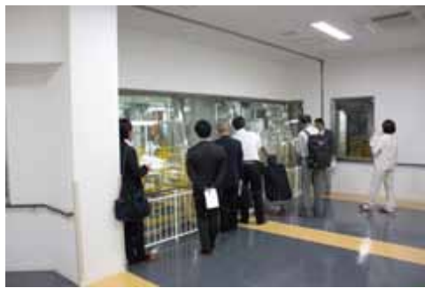
見学者ホールの検証