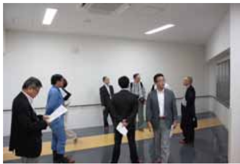
見学者ホールの検証