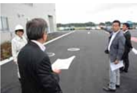
外観より雪室の確認