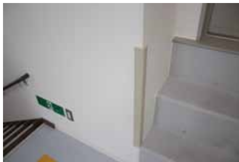
コーナーガードの検証