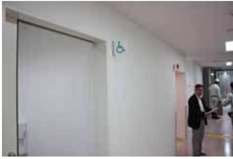
身障者用トイレの検証