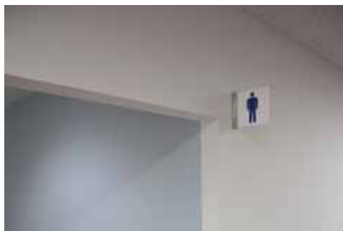
男性用トイレの検証