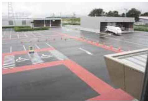
身障者・バス駐車場の検証