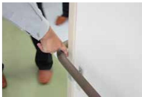
コーナーでの手摺の検証