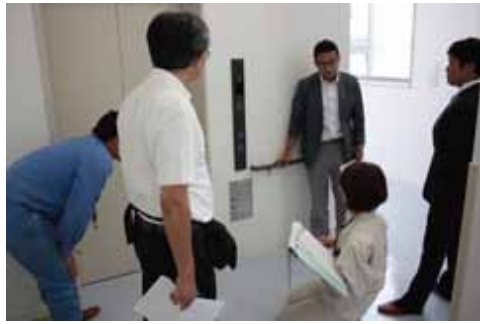
エレベーター警報盤の検証