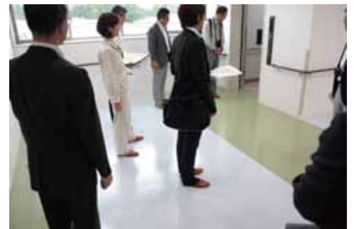
エレベーターの検証