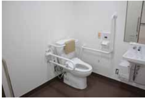
トイレ内での検証