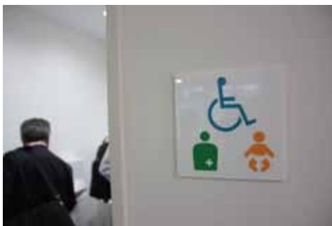
だれでもトイレの案内検証