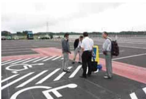
身障者用駐車場の検証