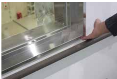
窓枠の角での安全性の検証