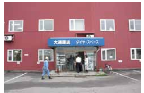
施設から打ち合わせ会場への移動