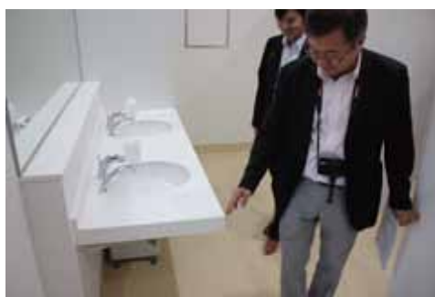
洗面台の安全性の検証