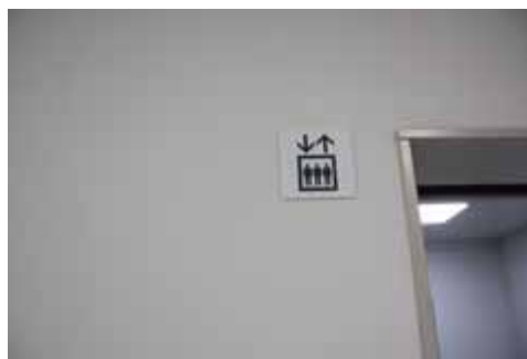
エレベーター表示の検証