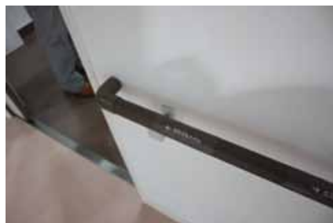
だれでもトイレの点字検証