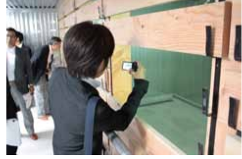
雪室の安全性の検証