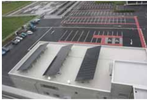
見学者ホールからの検証