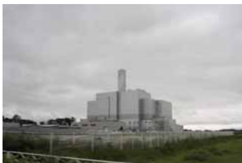
上越新幹線と東北新幹線を乗り継ぎ 岩手県中部広域クリーンセンターへ移動