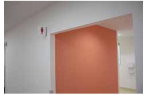
女性用トイレの表示検証